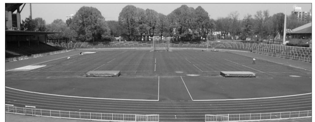
Mit Hilfe des Investitionsprogramms für kommunale Sporteinrichtungen konnte die Sanierung des Stadions Rote Erde realisiert werden.

Und zum Zweiten trägt die Umnutzung der alten Hoesch-Flächen in Hörde dazu bei, auf der einen Seite mit dem Phoenix-See ein hoch attraktives Freizeitgebiet aufzubauen und auf der anderen Seite im Westen großzügige Flächen für die Neuansiedlung von modernen Unternehmen bereitzustellen.