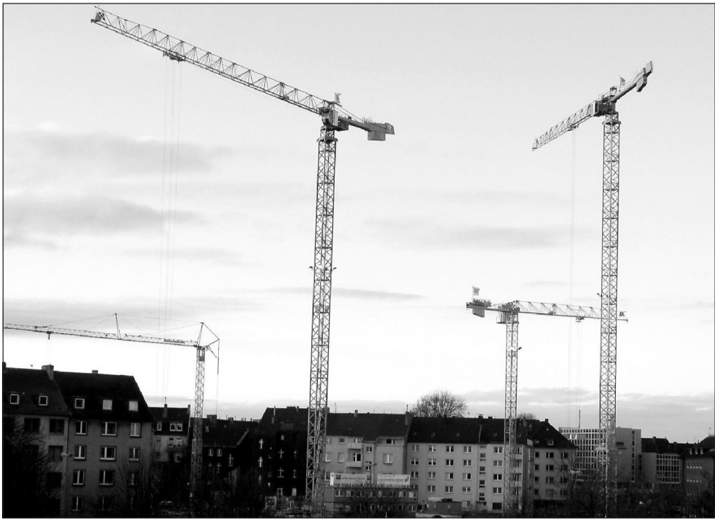
Zahlreiche Kräne drehen sich zurzeit in Dortmund. Hier die Baustelle des neuen Gebäudes der Volkswohlbund-Versicherung.