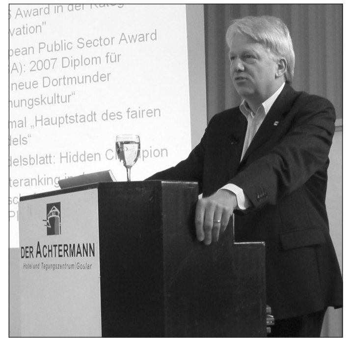
Stadtdirektor Ullrich Sierau fasste die deutlich sichtbaren Erfolge in der Dortmunder Stadtplanung in seinem Vortrag für die SPD-Fraktion bei der Klausurtagung zusammen

Boulevard Kampstraße: nachdem die Ost-West-Verbindung der Stadtbahn unter die Erde gelegt wurde, können jetzt 23 Millionen Euro in die Kampstraße investiert werden, um sie zu modernisieren. Die Arbeiten laufen seit dem vergangenen Jahr auf Hochtouren.