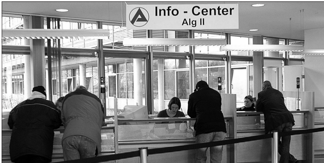
Vor einer ungewissen Zukunft steht die JobCenter ARGE, die Dortmunder Arbeitslose betreut, da die CDU einer notwendigen Reform Steine in den Weg legt.