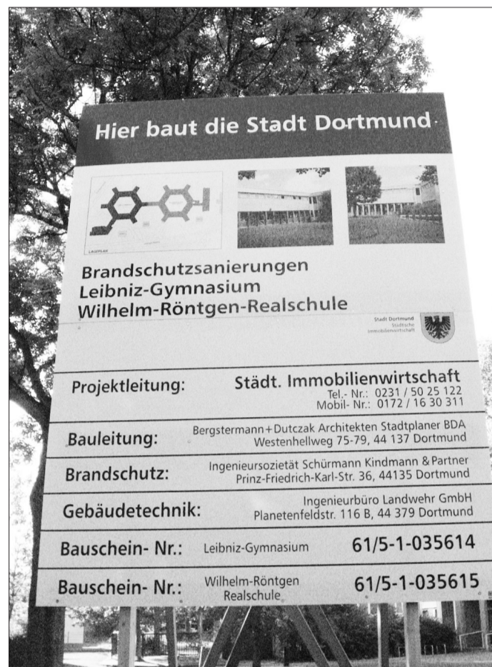
Hier baut die Stadt: Diese Schilder sind in Dortmund demnächst noch öfter zu sehen.

Die Verwaltung hatte zuvor zahlreiche städtische Maßnahmen und Projekte aufgelistet, nach verschiedenen Kriterien bewertet und auf schnelle Umsetzung hin untersucht, um unverzüglich mit der Auftragsvergabe beginnen zu können. Immerhin soll die Hälfte der Maßnahmen bereits in diesem